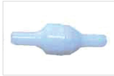
8. Check Valve