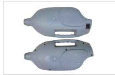
11. Body-R, L