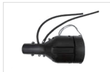
6. Case-Motor Assy