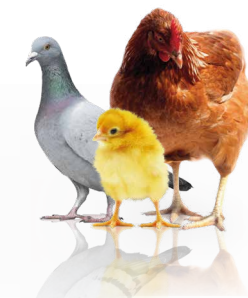
EN STÆRK FUGL